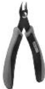
Art. Nr. 170688 Spezial-Seitenschneider

Vloeibare lijm in plastic-flacon met doserbuisje om nauwkeurig te lijmen.