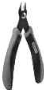
Art. Nr. 170688 Spezial-Seitenschneider

Vloeibare lijm in plastic-flacon met doseerbuisje om nauwkeurig te lijmen.